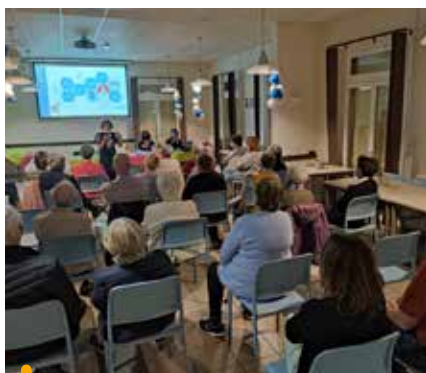
Une conférence pour mieux comprendre la maladie d'Alzheimer et accompagner les aidants des personnes malades

5 jours de partage, découverte, danse, loisirs et festivités, qui ont rassemblé des centaines de Venellois