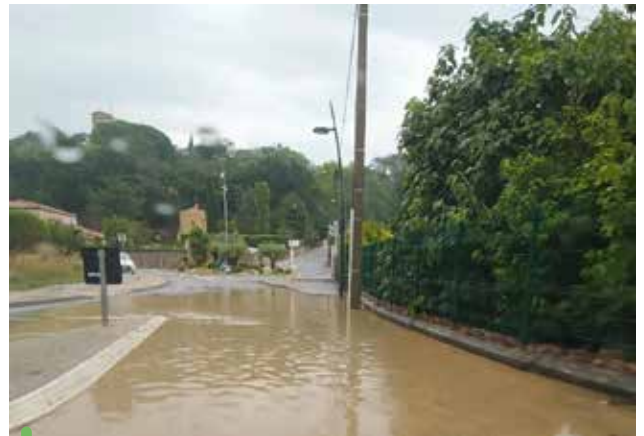
Pour exemple, la route de Coutheron

Les épisodes pluvieux que nous avons subis au mois de septembre ne peuvent que confirmer la sensibilité hydrologique de Venelles. L'urbanisation désordonnée ne fait qu'amplifier ce phénomène !