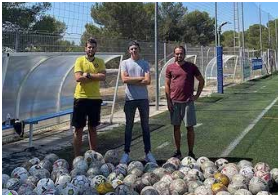
L'USV a remis 120 ballons de foot à des associations engagées dans le sport pour tous

Incontournables pendant la crise sanitaire en dépit de leurs difficultés pour fonctionner normalement, les associations sont plus que jamais au cœur de la vie citoyenne. Avec l'élan de la transition sociale, économique et environnementale impulsée sur le territoire, leur esprit de cohésion et de fraternité se conforte jour après jour.