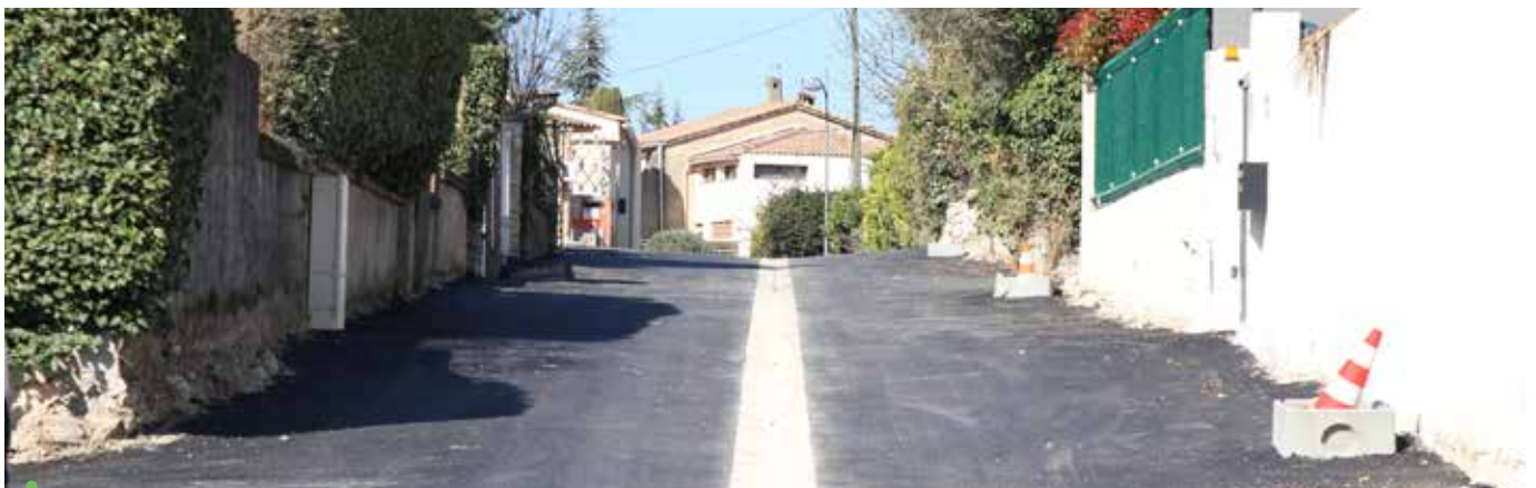
Impasse de l'Espigoulier : création d'un caniveau central raccordé au réseau pluvial afin de collecter les eaux de pluies.