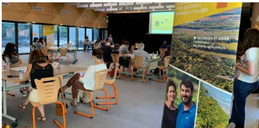
Concertation avec les habitants le 24 juin dernier à Venelles proposée par la Société d'aménagement foncier et d'établissement rural (SAFER) sur les enjeux agricoles

« C'est important que les habitants puissent exprimer leur avis sur des évolutions qui concernent leur commune et son