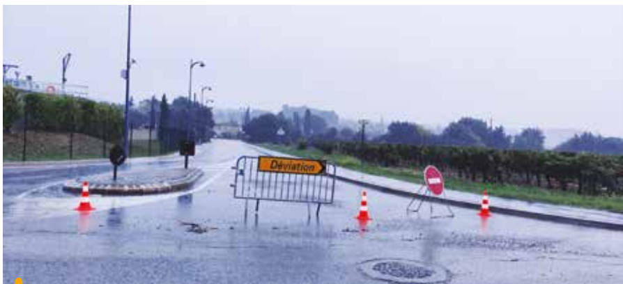
Sécurisation des circulations le 4 octobre dernier après déclenchement du PCS

Le 4 octobre 2021, l'alerte rouge pour pluie-inondation est déclenchée par Météo France pour l'ensemble du département. Une situation qui rappelle que la commune doit gérer des risques majeurs autant par un travail de prévention que de gestion en situation d'urgence. C'est tout l'objet du Plan communal de sauvegarde (PCS) dont les procédures sont actualisées tous les deux ans.