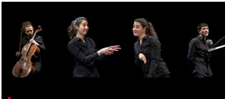
I Goupil, un spectacle adapté aux sourds et malentendants

Depuis de nombreuses années, Venelles coopère avec des organismes proposant des dispositifs d'accès à la culture pour tous. Cet engagement vers l'ouverture à la différence restera un axe fort du développement du futur pôle culturel.