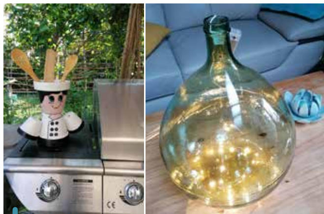
Les recycleries éphémères proposées par Recyclaïx chaque année

En complément de toutes ces opérations destinées à valoriser des matériaux, divers projets voient le jour chaque année à Venelles. L'objectif ? Limiter les déchets. Du côté des cantines scolaires, les petits Venellois restent pleinement investis dans la lutte contre le gaspillage alimentaire ; une action récompensée notamment par la certification « Mon restau responsable® ». Quant au restaurant municipal des Seniors la Campanella, une étude menée en septembre dernier en partenariat avec la Métropole a démontré l'absence de gaspillage alimentaire : les assiettes repartent vides, signe de comportements responsables et d'un équilibre étudié dans les menus.