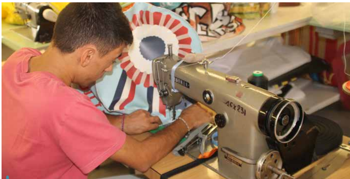
Les banderoles événementielles de Venelles sont transformées en objets originaux et pratiques

Les initiatives des associations, très engagées sur le territoire venellois, confirment que ce bénéfice environnemental se conjugue avec succès avec une économie circulaire.