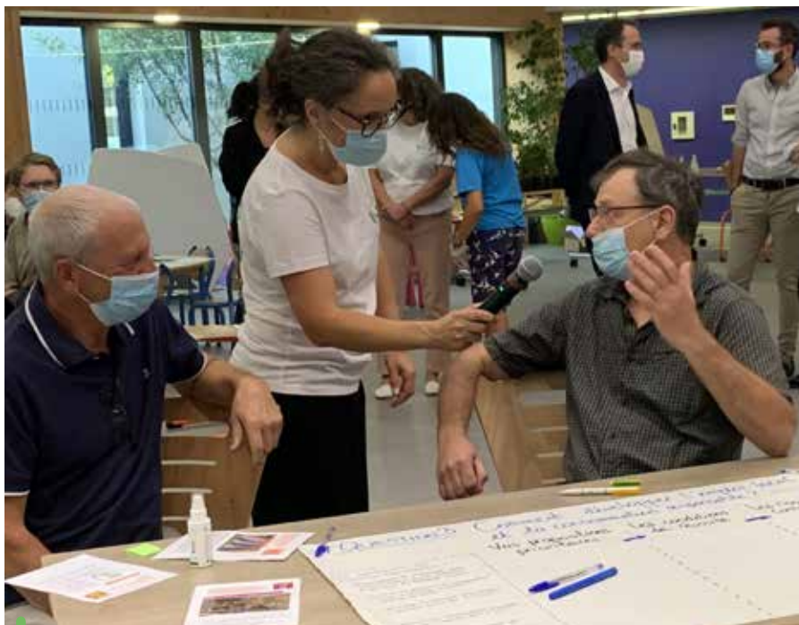
Des échanges nourris lors des ateliers participatifs d'octobre

Avec près de cinq cents questionnaires recueillis et quatre ateliers participatifs, émergent des pistes d'actions locales proposées par les Venellois.