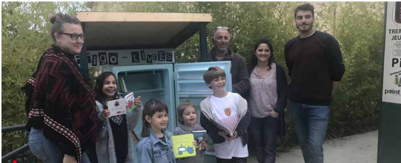
Le Frigo-livres inauguré le 20 octobre dernier

Les actions déployées en faveur de la jeunesse dans la ville sont multiples. Pour le plaisir du partage.