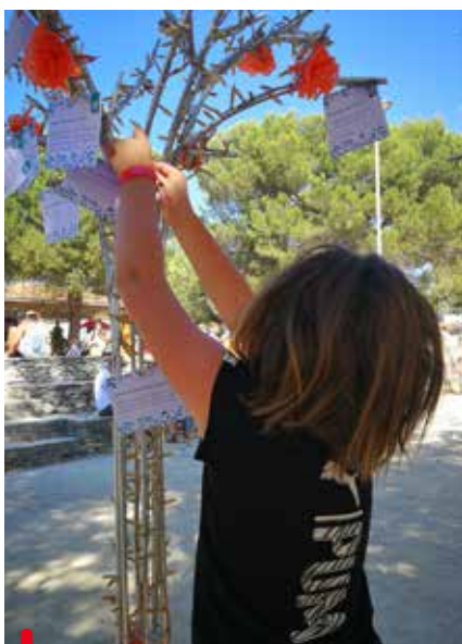
Appel d'idées sur le stand de la médiathèque aux Arts dans le parc et au cours d'un premier atelier participatif.

Si vous souhaitez participer à la phase créative, contactez la médiathèque par téléphone au 04 42 54 93 48 ou par courriel : mediatheque@venelles.fr . #venellesparticipative