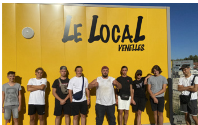
Le nouveau Local dédié aux 15-22 ans a son enseigne