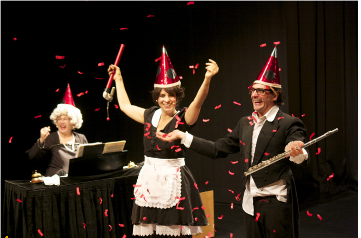
Le spectacle d'humour musical "Troppe Arie" par la compagnie italienne Trio trioche

Symbole de la magie et de l'éphémère propres à l'art du spectacle et du rayonnement culturel, L'Étincelle est le nom retenu pour le pôle culturel qui ouvrira ses portes début 2023.