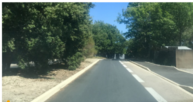
L'avenue du jas de Violaine récemment réaménagée et sécurisée, est dotée d'une voie cyclable