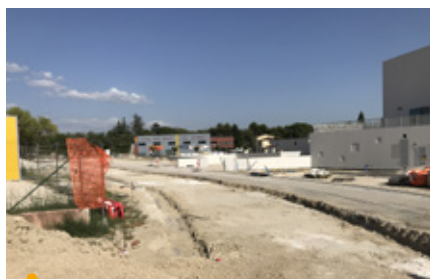
Allée du vieux canal

Améliorer et sécuriser la portion de voie située entre le giratoire des Anciens Combattants et la rue Eugène Bertrand, mais aussi pallier les dysfonctionnements des réseaux pluvial, d'eau et d'assainissement. Cette opération d'envergure sera portée par la Commune, la Métropole et la Régie des Eaux compétentes en matière de réseaux. Des études complémentaires sont en cours pour finaliser la conception de ce projet dont la concrétisation s'élèvera à plus de 3 M€.