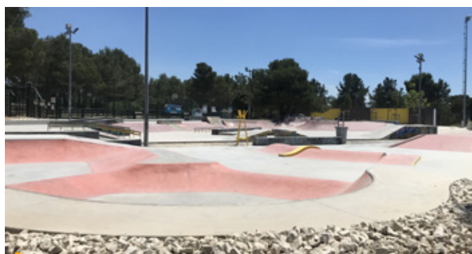
Un nouvel espace pour fans de glisse au skate park !