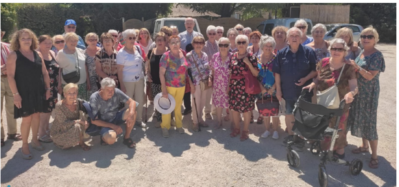
Le bien-être passe par plus de lien social - Journée dans le Luberon organisée le 8 juillet par le CCAS.

Bien-être, qualité environnementale et lutte contre la pollution... : les actions de prévention sont privilégiées pour sensibiliser les plus jeunes aux enjeux de santé. Des initiatives croisées invitent les enfants de Venelles à s'interroger et à agir. On retiendra par exemple la mise en place de capteurs de CO 2 dans toutes les classes des cinq écoles de Venelles (lire Venelles Mag #86 - p.8) pour surveiller la qualité de l'air. L'occasion aussi d'éveiller leur curiosité sur les gestes à faire pour respirer plus sainement. Cela passe également par une réflexion amorcée sur le plan de déplacement des établissements scolaires aux abords de l'école des Cabassols ou encore des ateliers yoga ou de respiration parfois proposés en classe pour mesurer les bienfaits de la méditation.