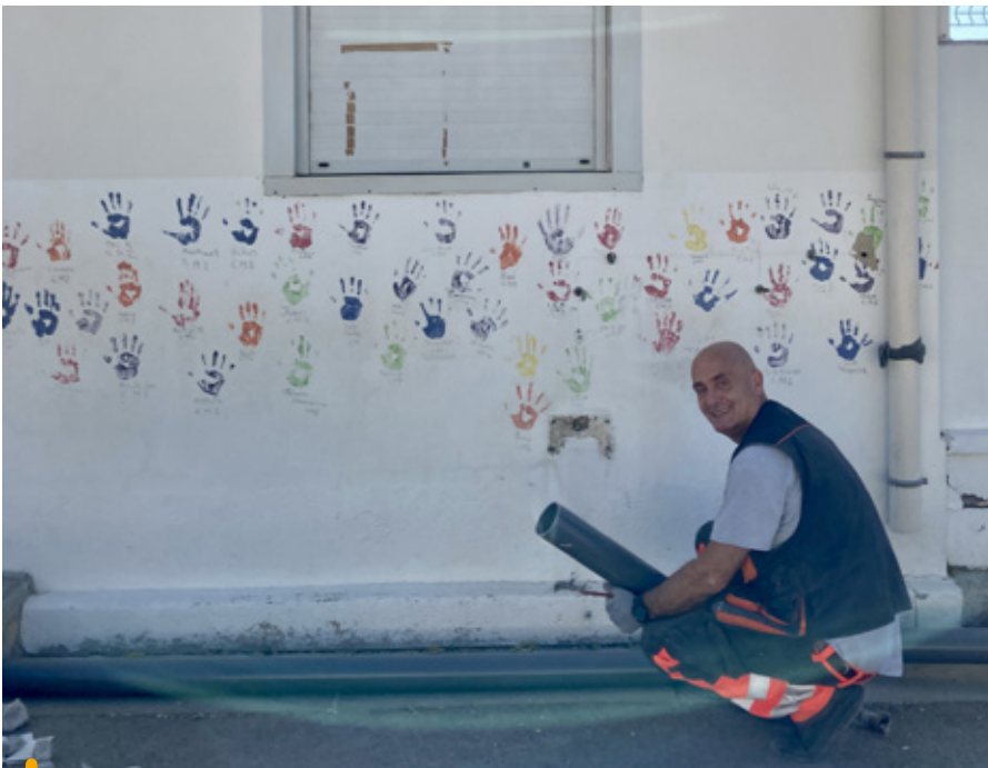
Des travaux pour préparer une belle rentrée aux quelque 800 élèves prévus pour cette rentrée !

Travaux dans les écoles, évolution des tarifs et simplification des démarches administratives pour les familles : que retenir pour la rentrée ?