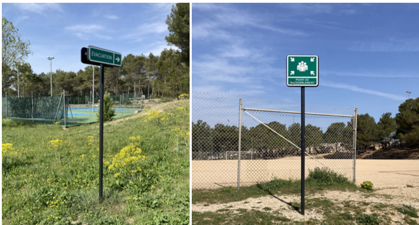
Le POMSE définit des zones de rassemblement et d'évacuation des publics

Le parc des sports a désormais son POMSE : le plan d'organisation de mise en sûreté dans un établissement public.