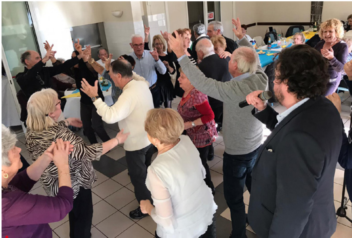
Le thé dansant : un moment fort de la Semaine bleue