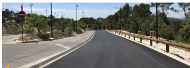
Après une 3 e phase de travaux, le chemin du Collet redon a été entièrement rénové jusqu'aux tennis