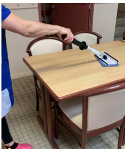
Le nettoyant écologique Cleanea® a été d'abord expérimenté à l'école des Cabassols et en mairie

La Mairie a investi dans une machine « Cleanea » afin de produire son propre désinfectant et détergent sur la base d'un procédé 100 % écologique : l'électrolyse du sel. Elle l'utilise pour nettoyer les bâtiments municipaux et ceux mis à la disposition des associations. Ce procédé fait partie des « mille solutions pour la planète » recensées par la fondation Solar Impulse. Objectifs ? Réduction de 80 % des déchets et baisse de 60 % de la toxicité pour les usagers des lieux. Une action inscrite à l'Agenda 2030 qui implique une refonte en profondeur des méthodes de travail des agents.