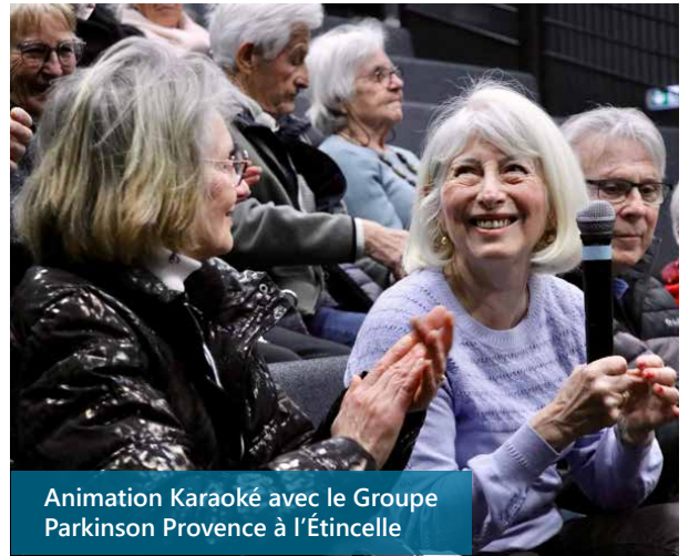
Animation Karaoké avec le Groupe Parkinson Provence à l'Étincelle