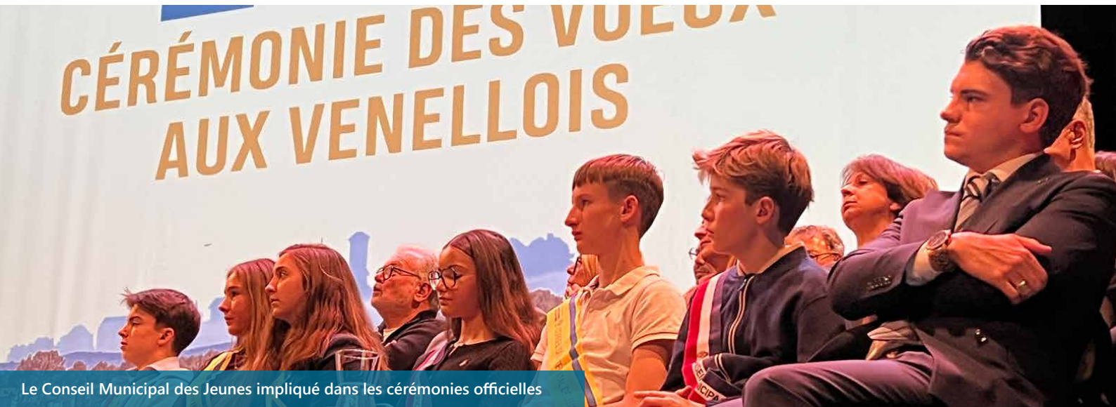
Le Conseil Municipal des Jeunes impliqué dans les cérémonies officielles