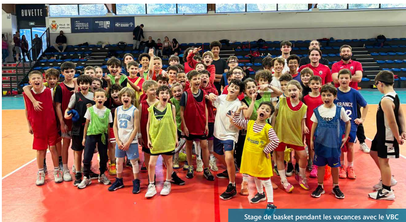
Stage de basket pendant les vacances avec le VBC