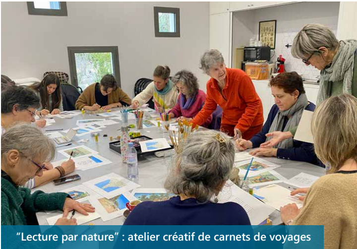
"Lecture par nature" : atelier créatif de carnets de voyages