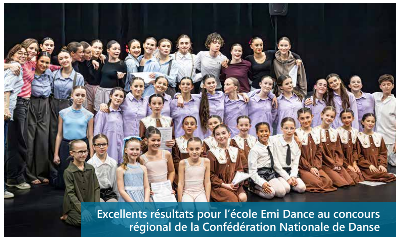
Excellents résultats pour l'école Emi Dance au concours régional de la Confédération Nationale de Danse