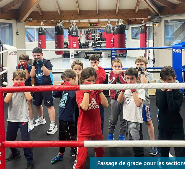
Passage de grade pour les sections boxe éducative et ados au NAPA