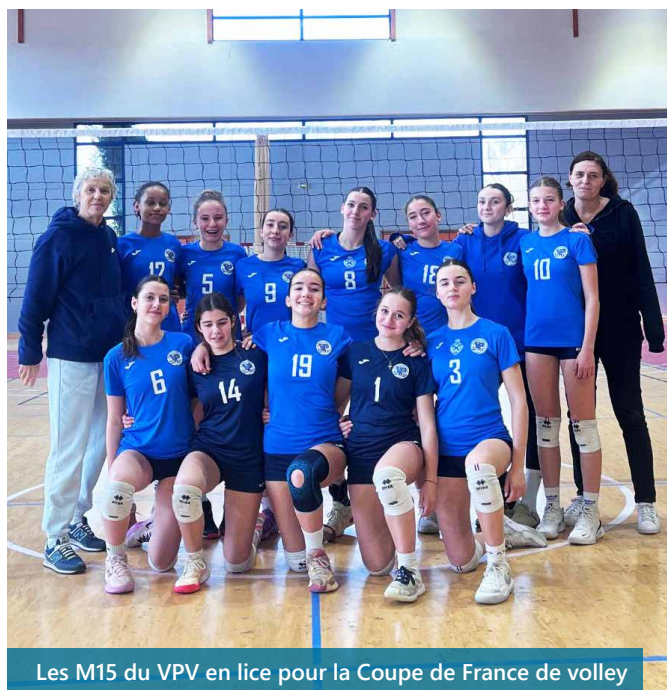
Les M15 du VPV en lice pour la Coupe de France de volley