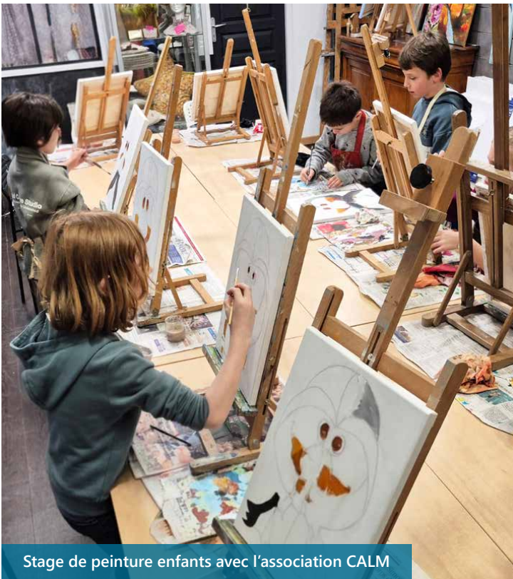
Stage de peinture enfants avec l'association CALM