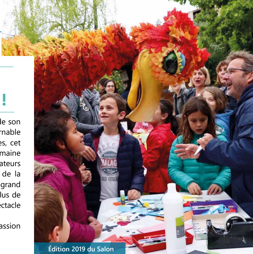
Édition 2019 du Salon