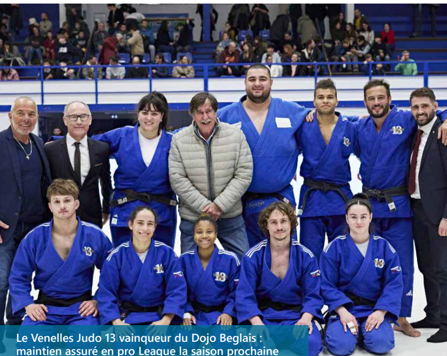
Le Venelles Judo 13 vainqueur du Dojo Beglais : maintien assuré en pro League la saison prochaine