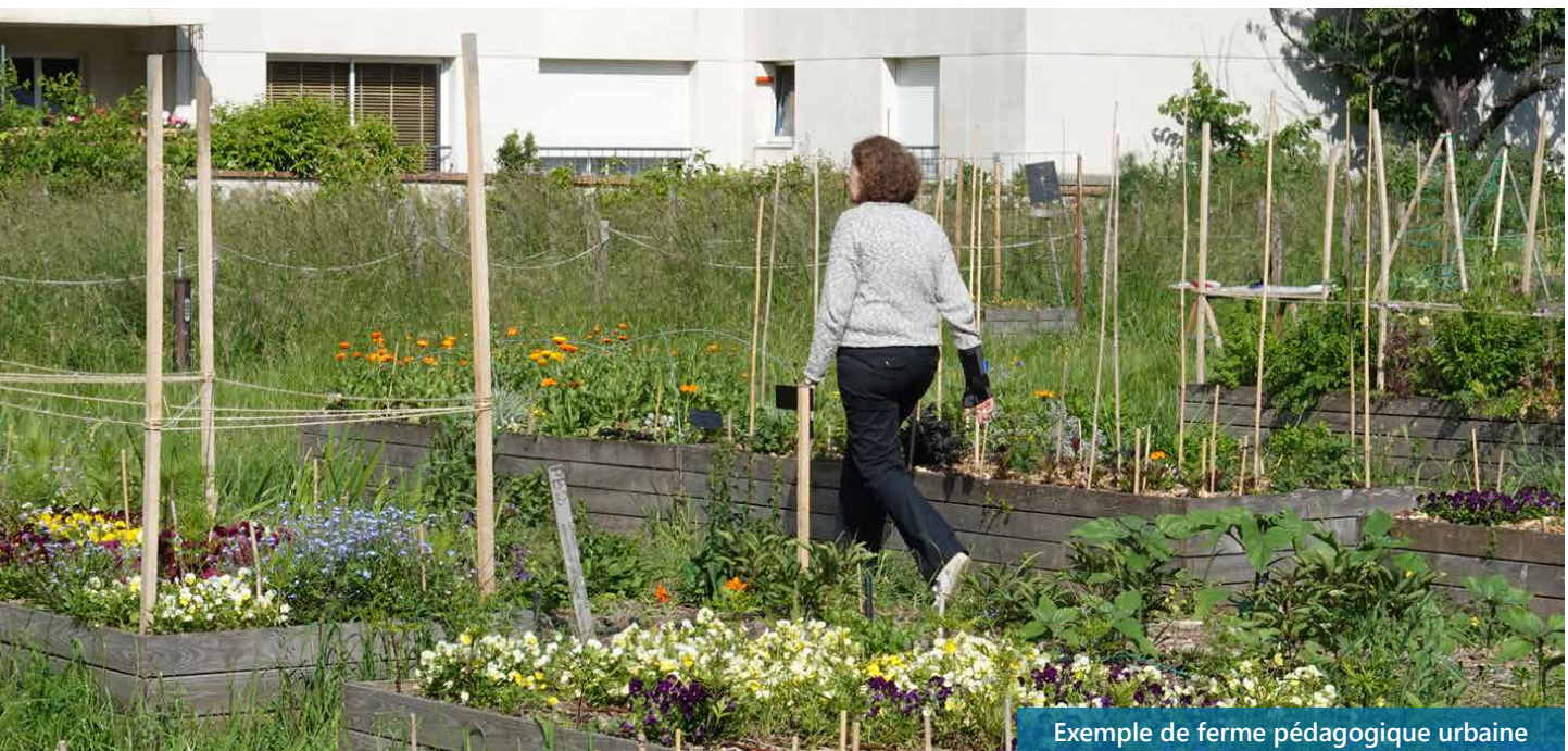
Exemple de ferme pédagogique urbaine

les priorités, les échéances. Cette réactualisation est une étape importante pour réajuster et hiérarchiser les projets restants, interroger peut-être la pertinence de certains et en définir de nouveaux. Avec toujours le même objectif : préserver l'environnement et le cadre de vie exceptionnel de notre commune. Tout cela se fera dans le dialogue avec les Venelloises et les Venellois, comme nous l'avons toujours fait.