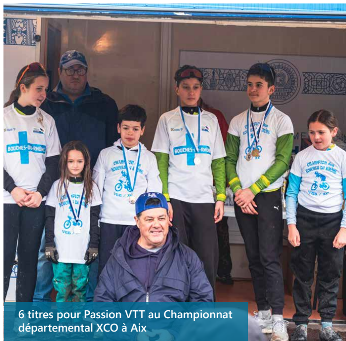
6 titres pour Passion VTT au Championnat départemental XCO à Aix