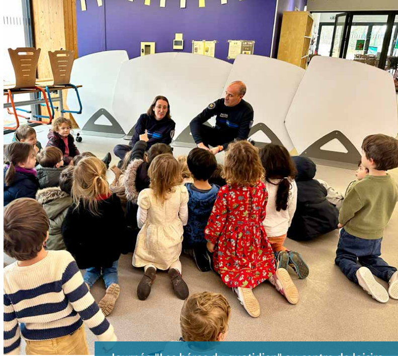
Journée "Les héros du quotidien" au centre de loisirs