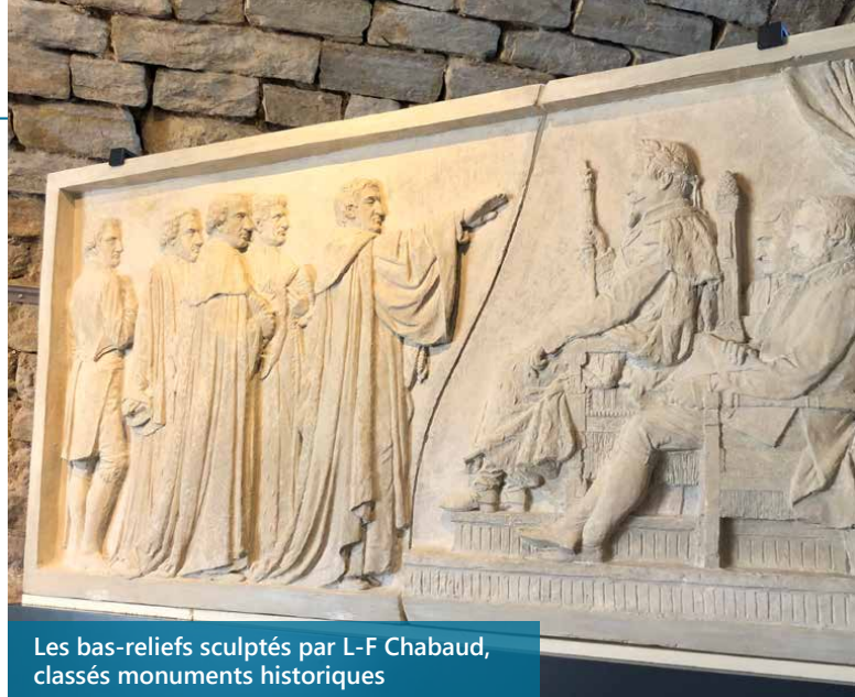
Les bas-reliefs sculptés par L-F Chabaud, classés monuments historiques

La voûte Chabaud, quant à elle, conservera son usage polyvalent tout en s'enrichissant d'une exposition permanente mettant à l'honneur la culture provençale.