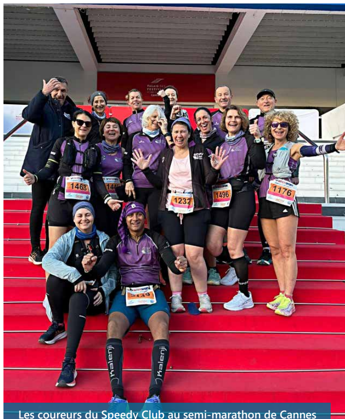
Les coureurs du Speedy Club au semi-marathon de Cannes