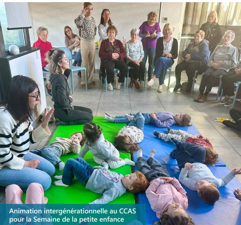
Animation intergénérationnelle au CCAS pour la Semaine de la petite enfance