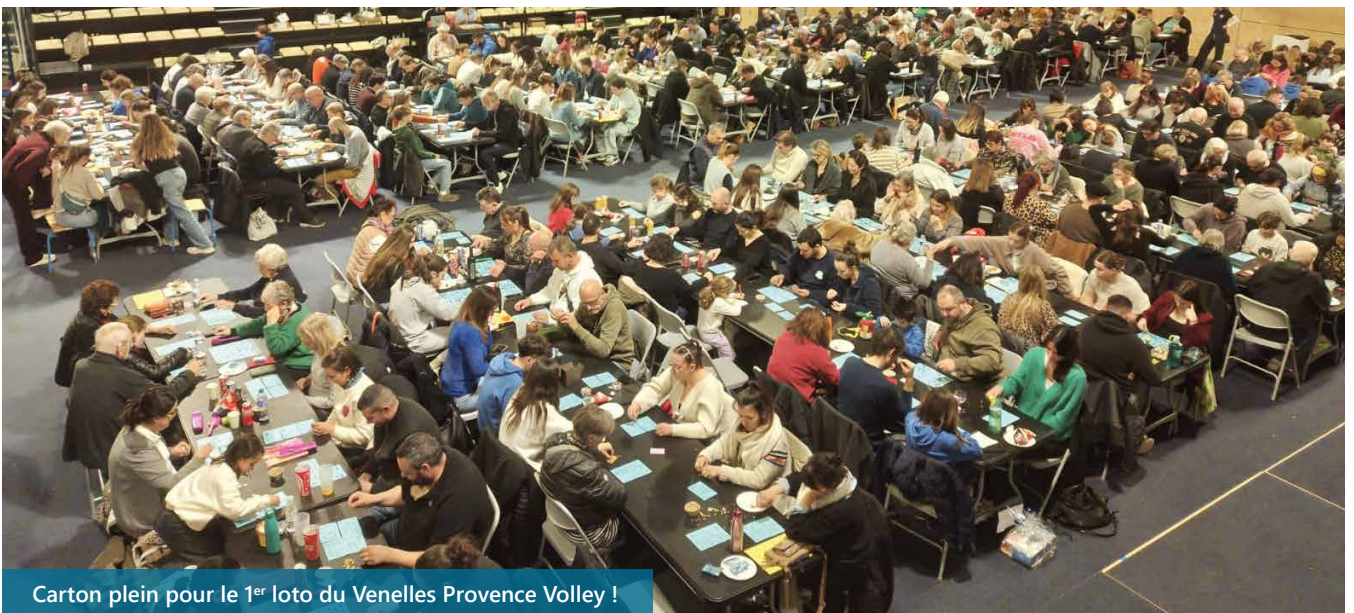
Carton plein pour le 1 er loto du Venelles Provence Volley !