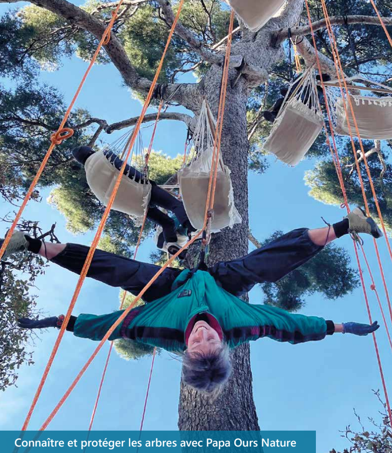
Connaître et protéger les arbres avec Papa Ours Nature