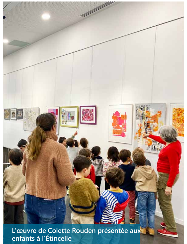
L'œuvre de Colette Rouden présentée aux enfants à l'Étincelle